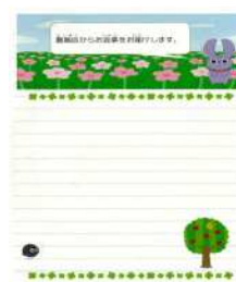
返信用の専用便箋