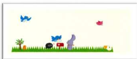
返信用の専用封筒