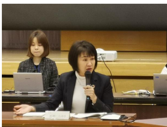
活発な意見交換の様子②