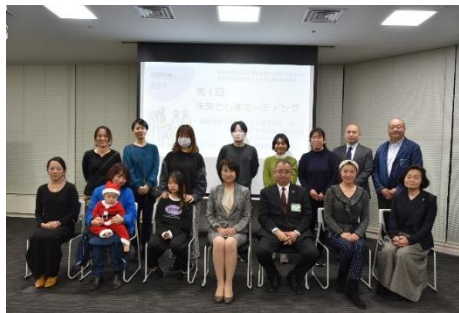
参加者で記念撮影