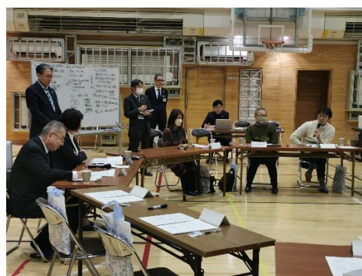
活発な意見交換の様子①