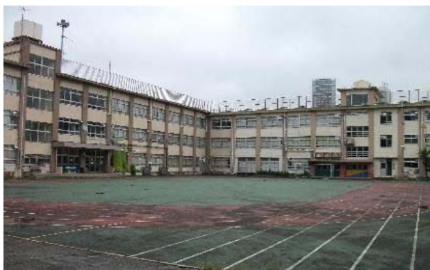
【校舎解体が予定されている 旧高田小学校】