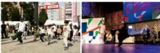
▲チームとしまでのプレゼンをきっかけに実現した TOSHIMA STREET FES 2023

地域課題に対し、企業と区がフラットに向き合い、解決を目指し、これまでにない発想、スピード感で新たな価値を創造します。