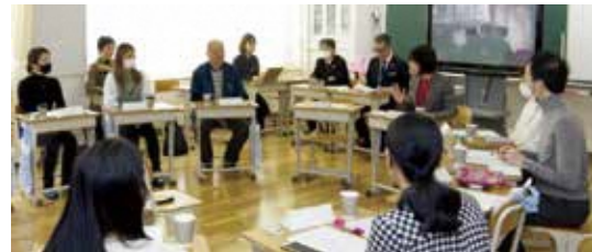
▲第3回未来としまミーティング

区政の課題をテーマに、区民と区長が双方向による対話を行い、区民の区政に対する関心や理解を深めるとともに、区民視点での区政運営を実現します。令和6年度も環境、福祉、子育て支援などをテーマに開催します。