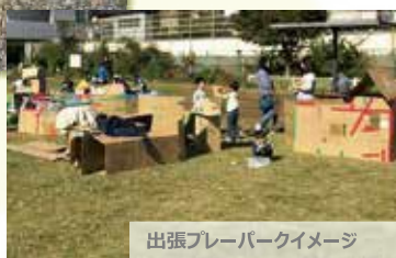
出張プレーパークイメージ