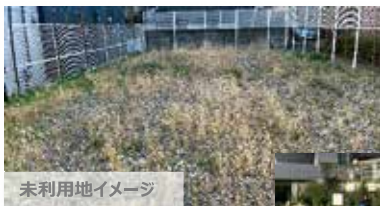
未利用地イメージ

柵などに囲われて使用されていない未利用地を、子どもの遊びの場やイベント利用などで暫定的に有効活用します。