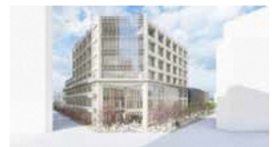
▲ 千川中学校 複合施設（イメージ）