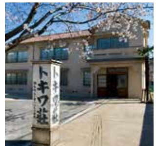
▲トキワ荘マンガミュージアム

南長崎地域と連携し、トキワ荘マンガミュージアムを中心に、マンガを基軸とした回遊性の高いまちづくりを推進します。