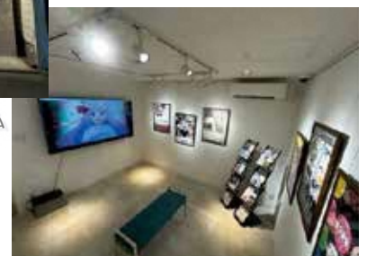
▲トキワ荘マンガミュージアムサロン （情報発信・交流スペース）