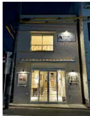
▲トキワ荘マンガミュージアム サロン（外観）