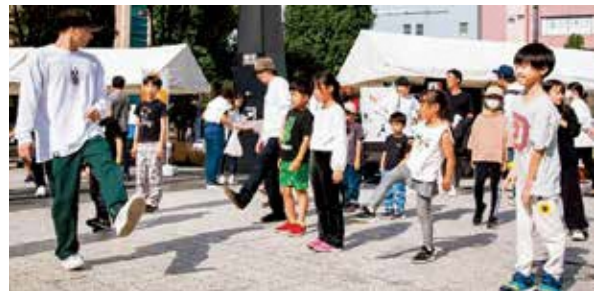
▲TOSHIMA STREET FES.2023（ブレイクダンスを教える様子）

産官学連携プラットフォーム「チームとしま」から生まれた、ストリートカルチャーの都市型フェスでは、ブレイクダンスなどのアーバンスポーツ体験、国内外のトップアスリートによるダンスバトル、アート、ミュージック、フードエリアなど、誰もが楽しめるイベントを開催します。