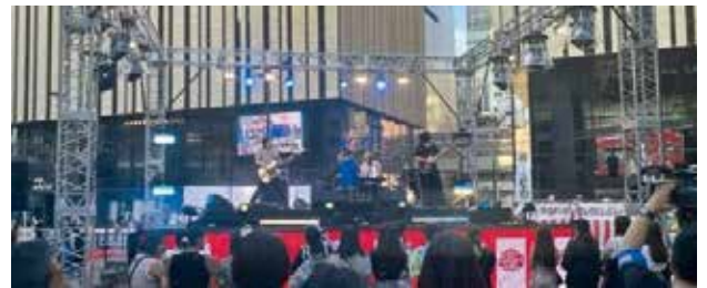
▲Hareza池袋での音楽によるアニメのまちづくり

「Hareza池袋での音楽によるアニメのまちづくり事業」として、池袋駅東口のアニメの拠点である中池袋公園をメイン会場に、アニソンイベントなどを実施します。