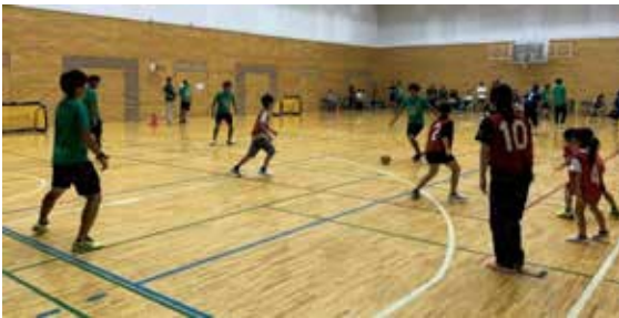
▲スポーツイベント（インクルーシブサッカーフェスタ）

子どもたちを対象としたスポーツイベント（パラスポーツ含む）を通年で実施するとともに、子どもの居場所・遊び場づくりのため、新たにスポーツ施設を無料で一般開放します。