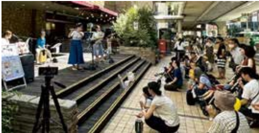
▲バスキングショーの様子

としまミュージックサークル（バスキングショー）を開催し、音楽によるまちづくりをテーマに、音楽パフォーマンスを区内の施設、公園、路上などで行い、まちの賑わいを創出します。