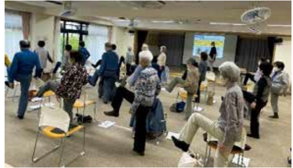
▲フレイル予防講座