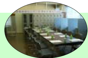
【区民活動センター】