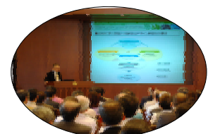
【協働シンポジウム】