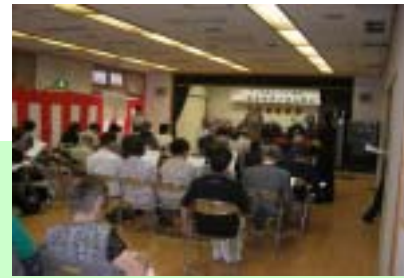
【区民ひろば運営協議会】