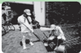
ビル・マンション清掃