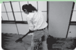
家事援助サービス