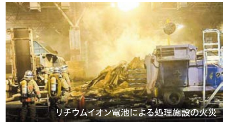
リチウムイオン電池による処理施設の火災