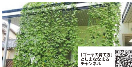
「ゴーヤの育て方」としまなまチャンネル