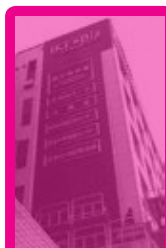
としま産業振興プラザ (IKE・b2)3階 エポック10