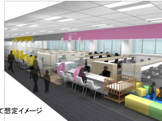
配置や色彩などすべて想定イメージ

提案No.7 サービスの“見える化”(窓口の待合に待ち時間表示のある案内板を設置し、サービスの“見える化”を図り、“不明”・“不安”のないサービスを提供)