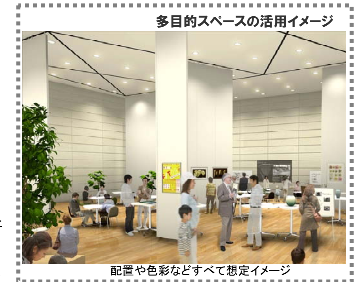
多目的スペースの活用イメージ

* 多目的スペースと区内のイベント開催施設との役割分担などを考える。* 災害発生時には災害対策の拠点として迅速に移行できるよう対応準備を進める。* 多目的スペースの活用以外に、議場等を有効に活用することを検討する。