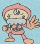
豊島区民社協キャラクター「ふくしい」