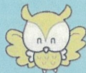
豊島区PRキャラクター「としま なままる」