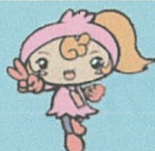
豊島区民社協キャラクター「ふくみん」