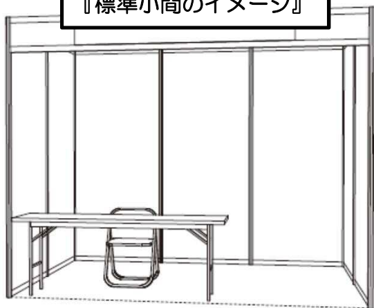
『標準小間のイメージ』