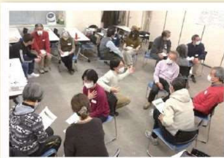
ポスター発表後の話し合い

多文化共生に携わる人材を育成するという講座の目標に沿って言えば、この活動は、私を含め講座のメンバーにとって、「多様性」について深く掘り下げ、「多様性」に対する態度や向き合い方について再考するきっかけにもなりました。他者との違う部分としての「多様性」が注目されがちですが、他者とのやりとりの中で、自分の中にある多様性を見つけて、自分は何者なのかと考えることも大事であることに気づきました。「どうして日本へ？」と聞かれる時、私はしばしば「自分探しの旅」と答えたりします。講座で学びあう皆さんと出会い、多様性とは何か、私は何者かについて再考できて、次へ進む勇気をいただきました。