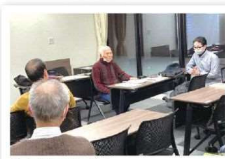
戦争体験を語る様子

時代に向き合う学びのテーマ選定と、活発な意見交換による思考の深まりは、としまコミュニティ大学・佐藤ゼミが目指してきたことである。本年度もまた、その成果を受講生と共有することができた。