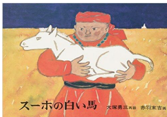
再話:大塚勇三 画:赤羽末吉 福音館書店

【略歴】1979年、画家・赤羽末吉の三男研三と結婚。 11年間に渡り、義父末吉の近くで暮らし、その日常に触れる。 末吉他界後、研三とともに、遺された約7,000点の原画、 スケッチ、資料等の整理に携わる。以降、赤羽末吉の人生、 また絵本についての研究を続け、現在、赤羽末吉の伝記を 執筆中。1952年、東京生まれ。