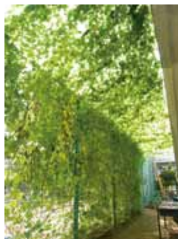
緑のカーテン（区民ひろば千早）