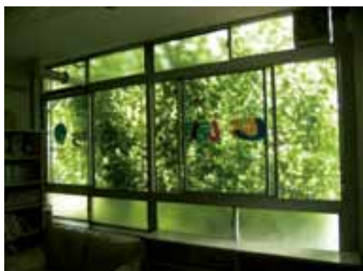
緑のカーテン（スキップ椎名町）