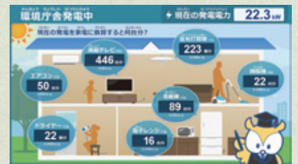
ディスプレイイメージ

エコヴェールの機能の1つ、太陽光パネルによって発電された発電電力などの情報を発信する予定です。