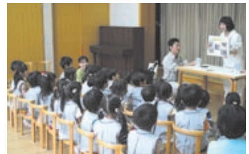
熱心に聞き入る幼稚園児たち

このようにミツバチプロジェクトを多くの方に知っていただく機会をつくり、ミツバチによって、生き物だけでなく、まち全体がつながっていくといいなと思います。