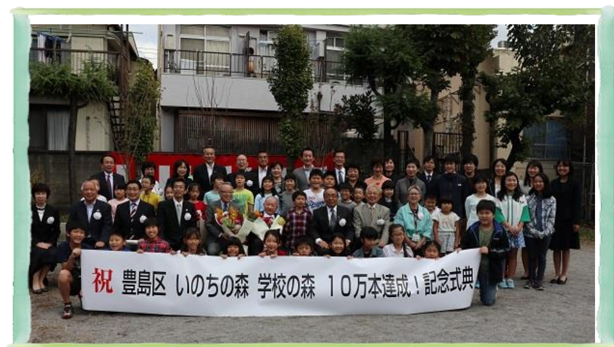
▲「いのちの森」「学校の森」10 万本達成記念式典

今回は、昨年 6・7 月に行った「学校の森」植樹の様子、「いのちの森」「学校の森」10 万本達成記念式典の様子をご紹介します。