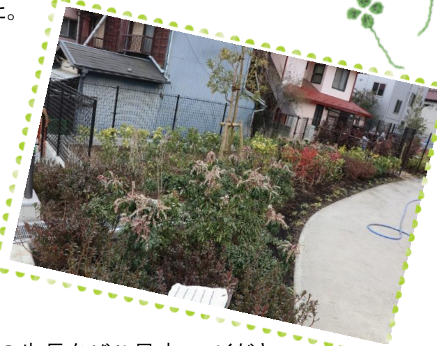
これからの生長をぜひ見守ってください。