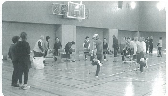
トレーナーの指導のもと気合いが入る