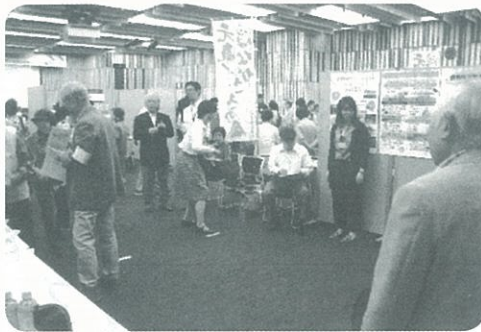
輪投げ体験を行う

今年、豊島区高連は高齢者福祉課管理Gの全面的ご支援をいただいで、役員・女性委員が中心となって展示・体験コーナー