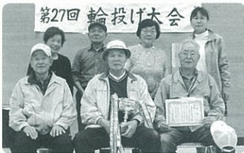
優勝チームの皆さん

点で競われました。熱戦を勝ち抜いた成績上位のチームは次のとおりです。優勝 長崎二丁目ことぶき会 準優勝 親和豊寿会 第3位 愛要会B