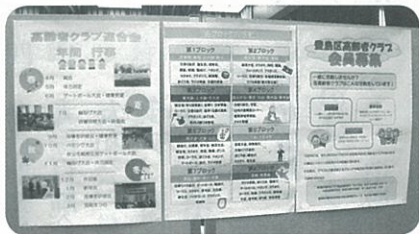
パネルで会員募集、活動内容を紹介

高齢者クラブの「活動紹介」や、「会員募集」の声かけ、チラシ配布を行いました。当コーナーに来場・参加される方は170名以上にのぼり、用意したチョコレートの参加賞が切れどでした。