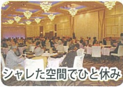
シャレた空間でひと休み

集合で、バス3台、総勢105名の一行は談合坂SAで集結。◆1番目の目的地山梨県立美術館見学