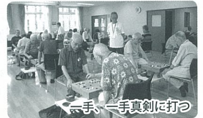
一手、一手真剣に打つ