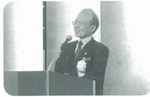
外山会長あいさつ

豊島区 高齢者クラ ブ連合会の 「新春のつど い」が1月 29日(月)、 ホテルメト