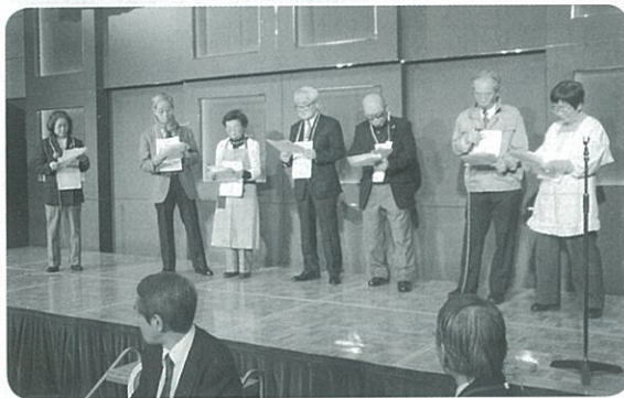
役員による寸劇で会場盛り上がる