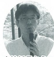
小嶋係長からの講義を受ける