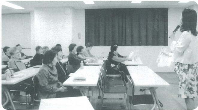
大声でトレーニング