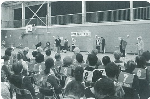
過去最多のチームが参加