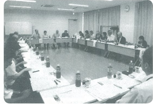
各区連合会で近況を報告