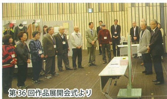
第36回作品展開会式より

結びに、貴会の益々のご発展と会員の皆様のご健勝を祈念申し上げます。新年のご挨拶いたします。