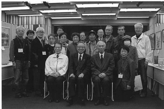
第34回作品展にて(としまセンタースクエア)

区高連会員減少の最大の原因は単位クラブの解散、休会、消滅などにあります。単位クラブの解散だけは絶対に全力で阻止しなければならぬと痛感しております。目標達成に全員で頑張ってまいりましょう。