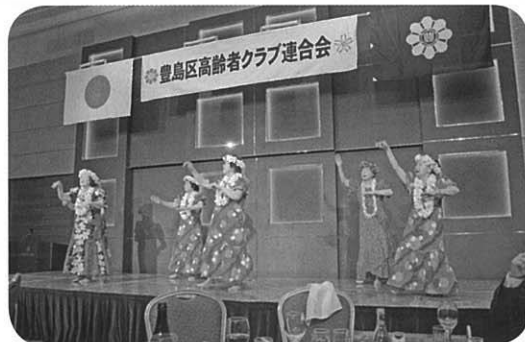
今年も宴に色を添えてとげぬき鵬栄会のフラダンス