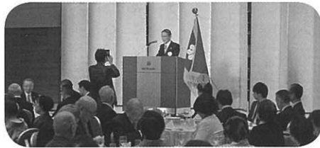
石塚会長あいさつ

平成28年・豊島区高連の「新春のつどい」が1月27日(水)、ホテルメトロポリタン3F富士で開催されました。