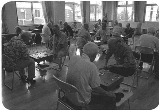
慎重に次の一手を考える

囲碁はクラス別トーナメント戦、将棋は総当たり戦で進められました。対局時間のギリギリまで粘り抜く様子が各盤上に見