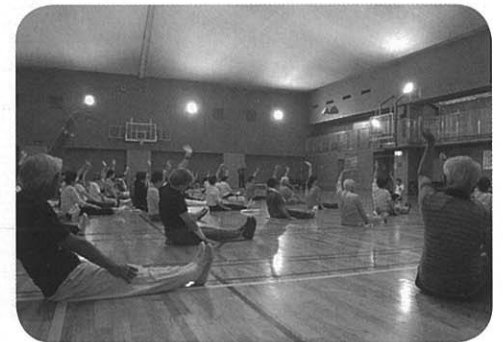
楽しみながら体を動かす