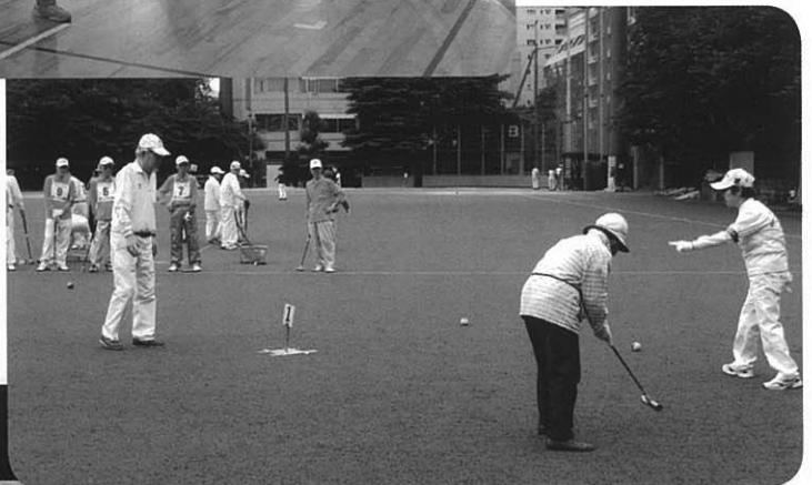
ゲートボール大会