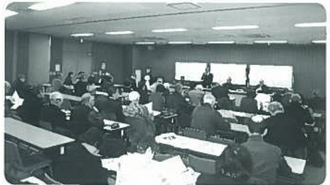
スムーズな議事進行