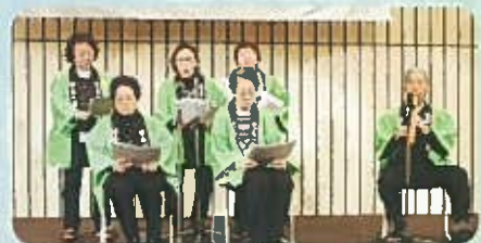
池袋本町一丁目福寿会