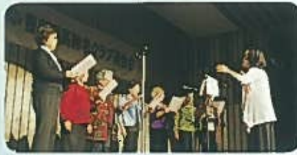
千早いこいクラブ