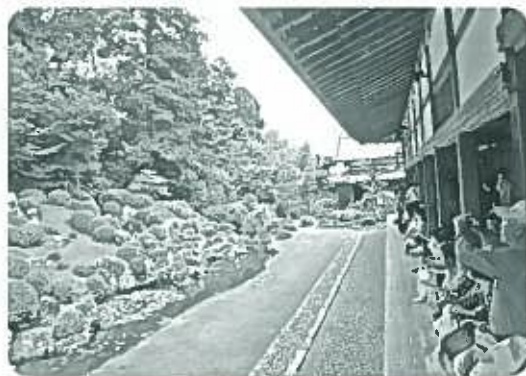
龍潭寺の見事な庭園

さかな屋物産店で昼食。その後、井伊直虎ゆかりの寺・龍潭寺へ。龍潭寺庭園の濡れ縁に腰を下ろしてゆっくり説明を聞いた。小堀遠州作・龍潭寺庭園は、江戸時代初期に造られた池泉鑑賞式の名園であると。井伊氏の