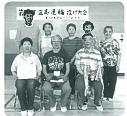
優勝した親和豊寿会チーム

7月4日(火)、千早地域文化創造館多目的ホールにて、近年にない35チームが参加。気温もぐんぐん上昇する中、4チームずつ9コートに分かれ試合開始。真剣な競技の連続、各所より歓声と落胆の声が入り混じり、熱戦が展開され、午前三ゲーム、午後3ゲームと予定どおり無事終了しました。