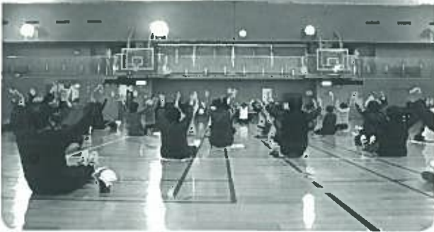
体と頭を動かす体操