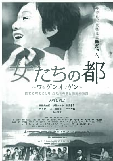
当日上映した映画のポスター

強い。みんなで力を合わせれば 何でもできる」との声。次回の 開催も楽しみだという声も多く 聞かれ、楽しいひとときとなり ました。真夏日の中、皆さまお 疲れさまでした。(女性委員会)