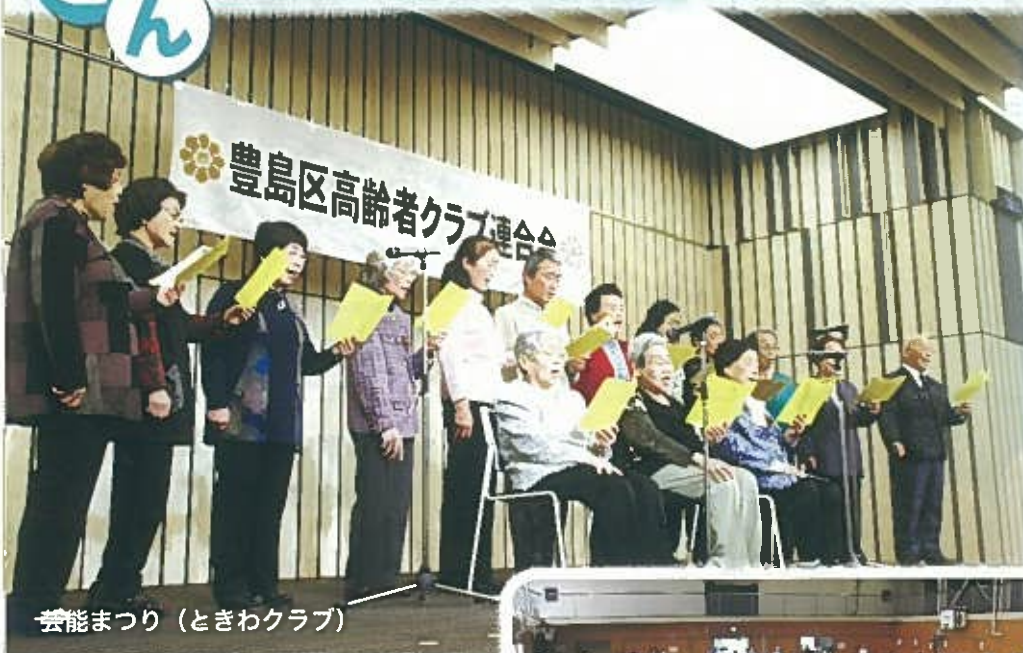
芸能まつり (ときわクラブ)

お友達と一緒に 楽しく老後を過ごすため 高齢者クラブに入会して 人生を満喫しましょう