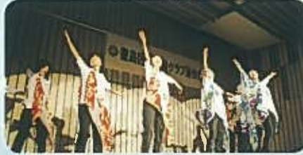
合同 大塚健康ダンス