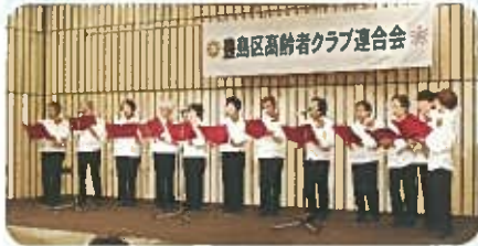
南長崎三丁目北部福寿会