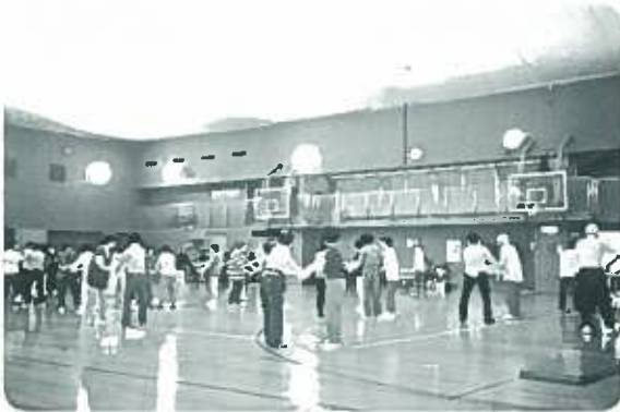
54名参加でフォークダンス