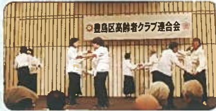
合同フォークダンスみち