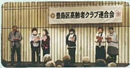
シスナブ健康文化クラブ