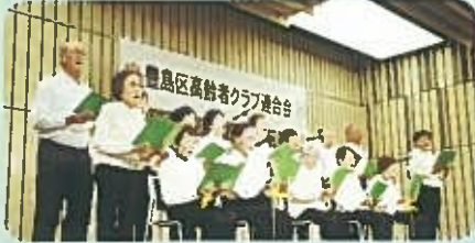
南長崎四丁目福寿会