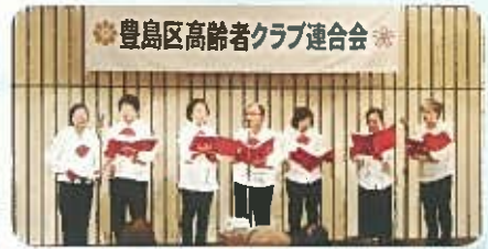
千川二丁目百々代会