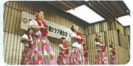
南六さくらクラブ