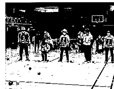
誰でもできる、やさしいボッチャです

と頷き、今は亡き夫との他愛ない喧嘩を思い出し、重ね合わせたり涙したり笑ったり、映画でし