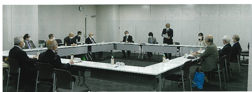
行政に直接希望や意見を伝えたり、説明を受ける機会です