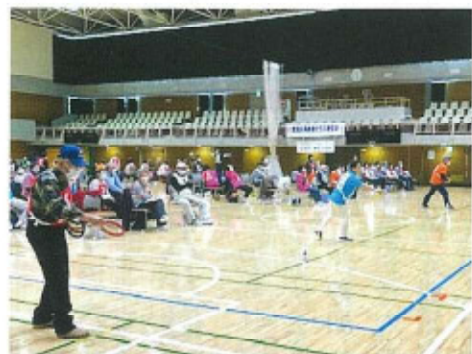
新年度のイベントは輪投げから

2月21日(火)午後、イケビズ6階ホールにて、後期の指導者研修会を開きました。今回は、区内のわれわれが直接お世話になっている高齢者福祉関係の現場の担当職員3名の方々から、直接次のようなお話しをお聴きしました。