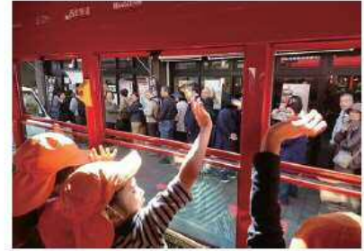
<IKEBUS から手を振る子どもたち>