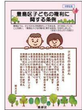
<「豊島区子どもの権利に関する条例」リーフレット>