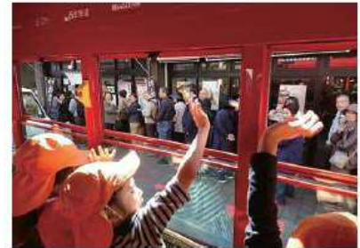
<IKEBUS から手を振る子どもたち>