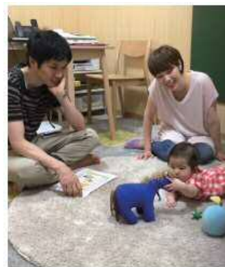
<ゆりかご・としま事業>

目標Ⅱでは、教育や福祉、保健、医療、更生保護などの関係機関が連携し、それぞれの専門性を活かしながら、子どもやその家族が抱える悩み・困難に向き合うことで、個々の発達段階に応じた、切れ目のない継続的かつきめ細やかな支援を行っています。また、全ての家庭が安心して子育てができるよう、子育て家庭への各種支援施策を推進しています。