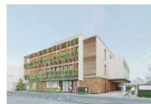
<児童相談所の完成イメージ図>