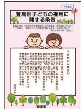
<「豊島区子どもの権利に関する条例」リーフレット>