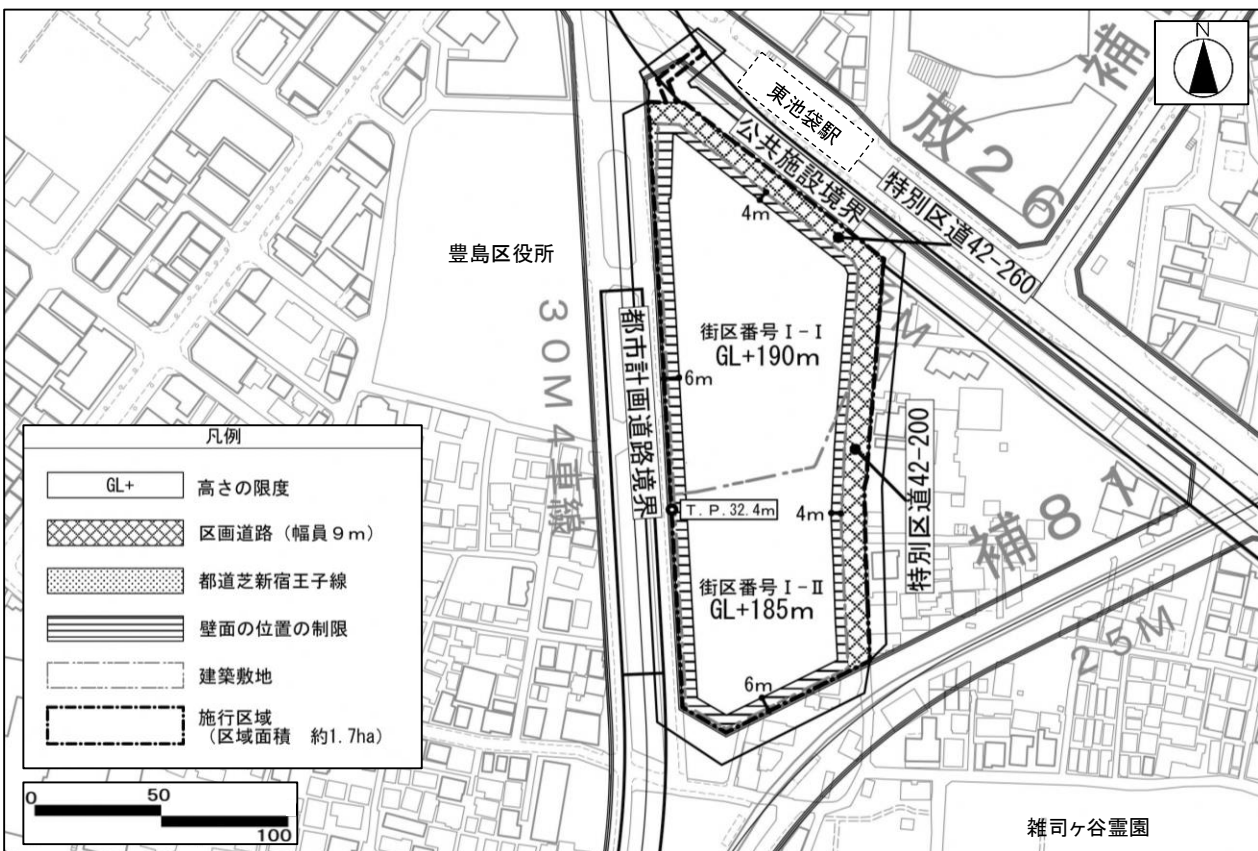
図-公共施設の配置及び建築物の高さの限度、壁面の位置の制限