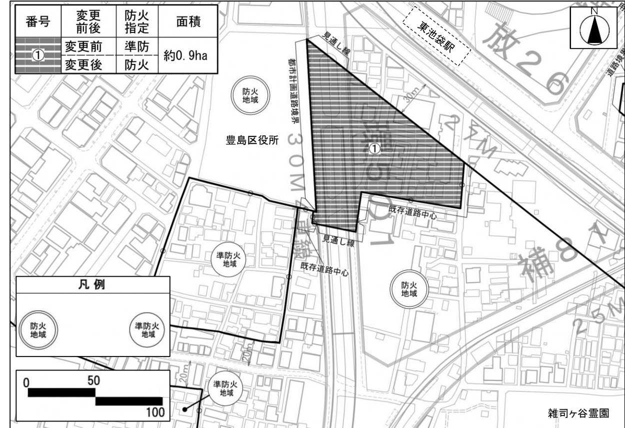
図-防火地域及び準防火地域

南池袋二丁目C地区地区計画及び南池袋二丁目C地区第一種市街地再開発事業の決定に伴い、都市防災上の観点から、防火地域及び準防火地域を変更します。