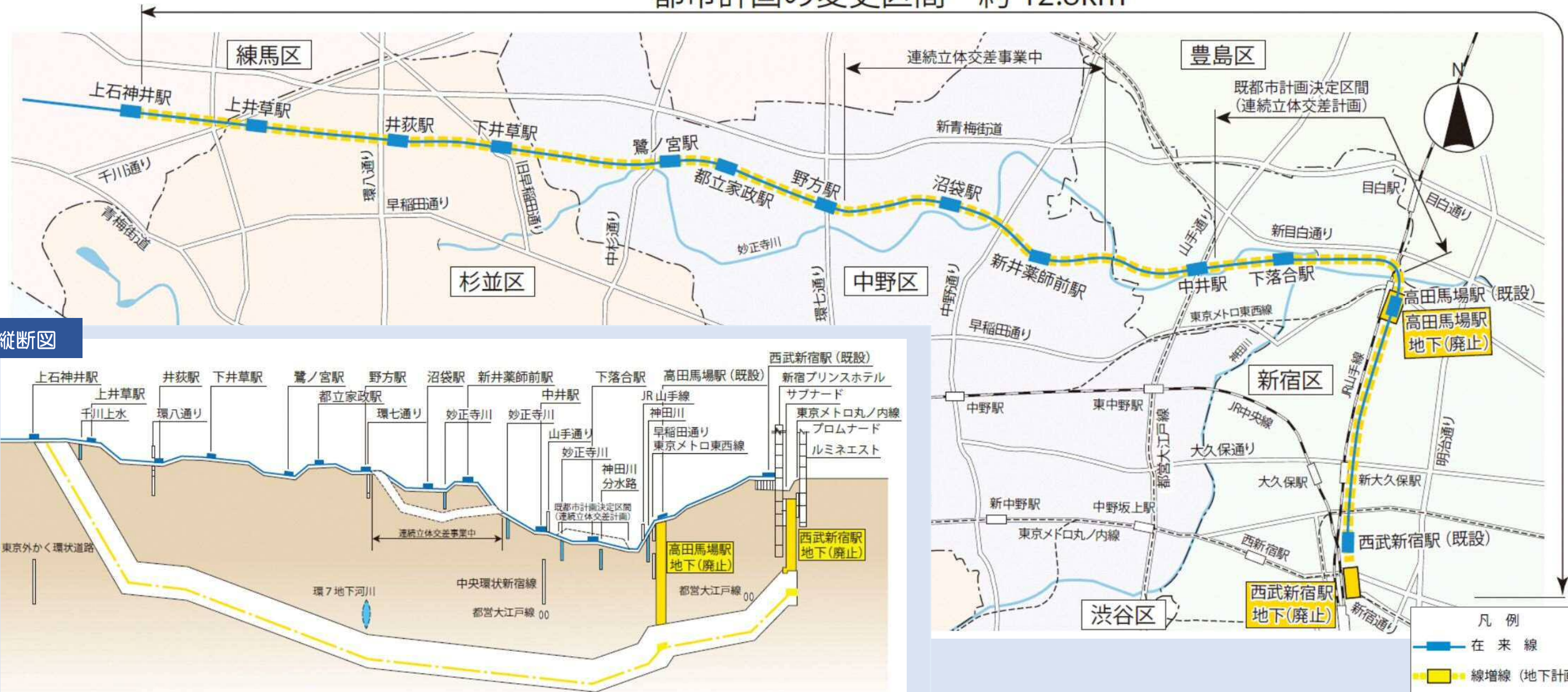
都市計画の変更区間 約 12.8km