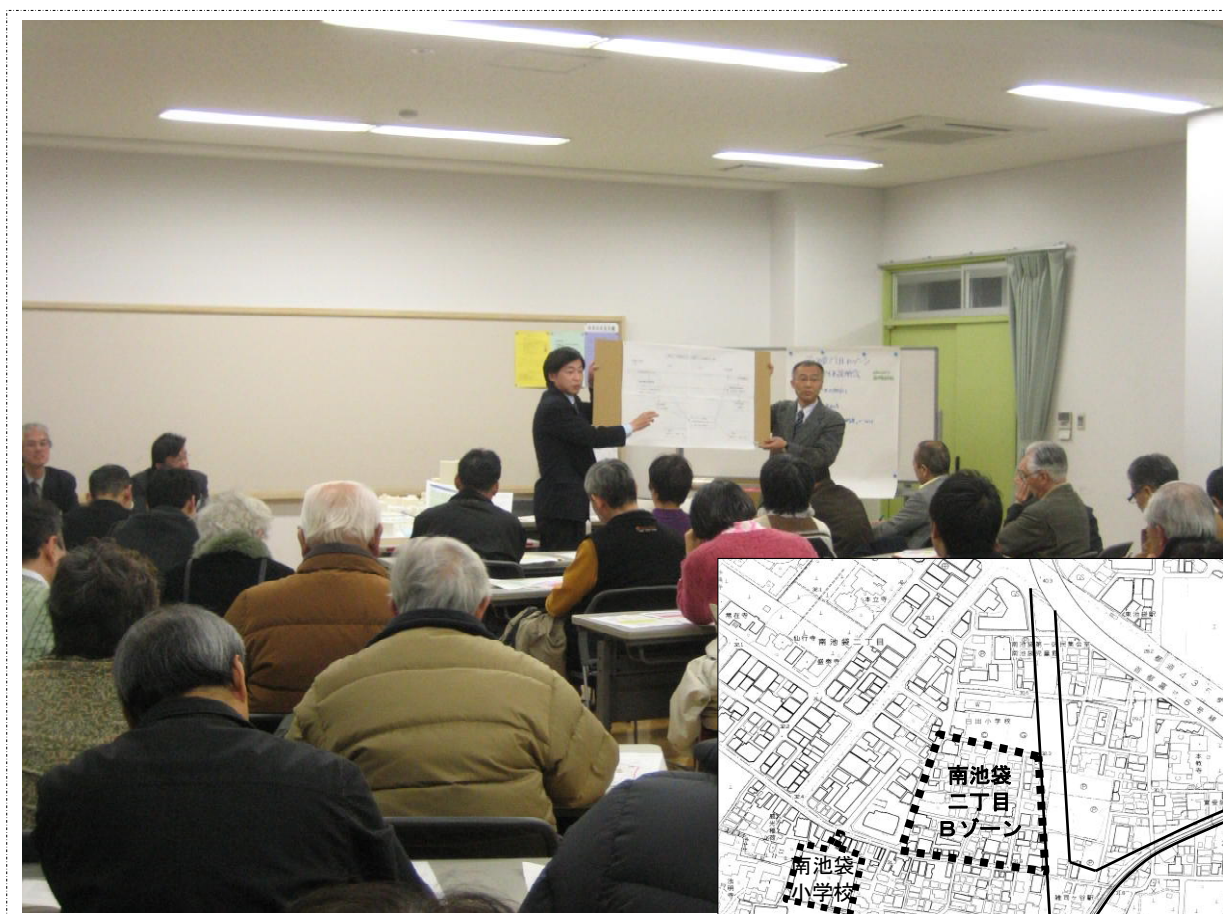
■当日の説明会の様子