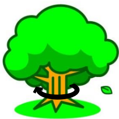
地上1.5mのところで 幹回り125cm以上