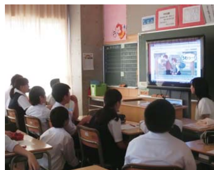
ICT を利用した授業の様子