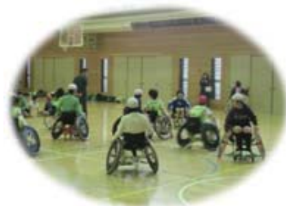
パラリンピック教育の様子

「アプローチ・スタートカリキュラム [改訂版]」の活用、区幼研と連携した幼児教育の充実