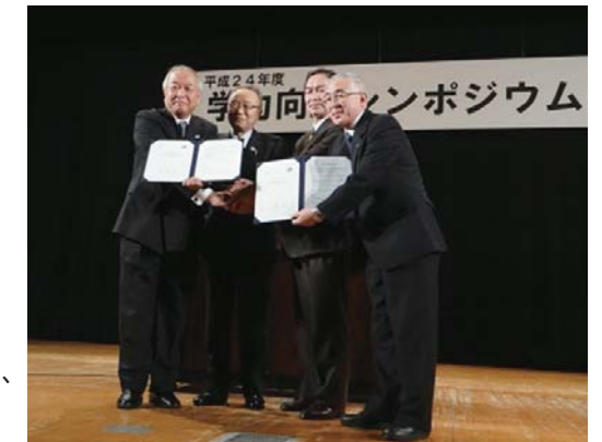
能代市との学力シンポジウム

不登校未然防止に向けた取組の強化 「心理検査『ハイパーQU』」の実施(小3~中3) 「不登校対策検討・推進委員会」の実施