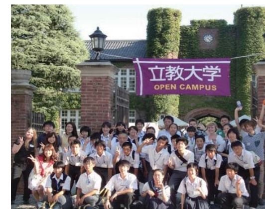
能代市中生とのイングリッシュキャンプ