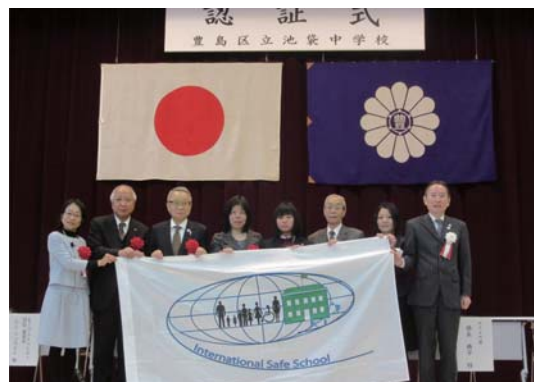
池袋中学校 認証式典

「インターナショナルセーフスクール」の取組と成果の共有 校内における事故の未然防止、交通事故の防止、「薬物乱用防止教室」の実施 【セーフスクール認証取得校】 仰高小、富士見台小、朋有小、池袋本町小、池袋第一小、池袋中、高南小 【セーフスクール認証取得宣言校】 清和小、さくら小、千川中