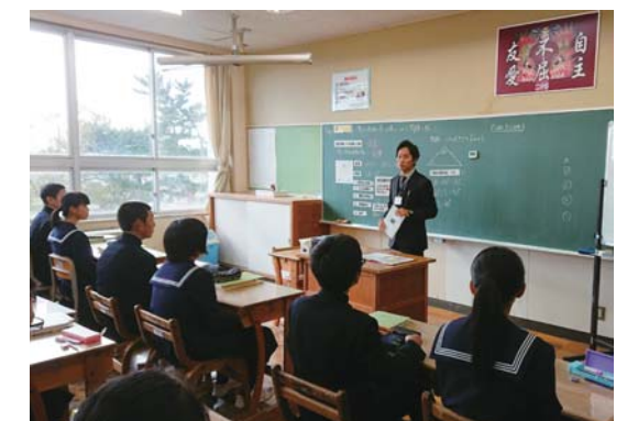
能代市への教員派遣