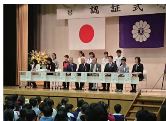
高南小学校 認証式典