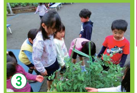
3 自然への興味やいたわりの心を育てる