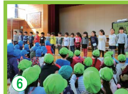
6 小学校や保育園との連携と交流