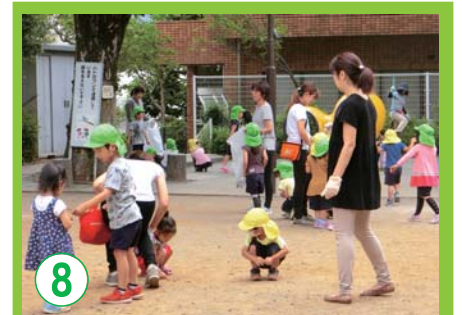
8 地域との積極的な交流