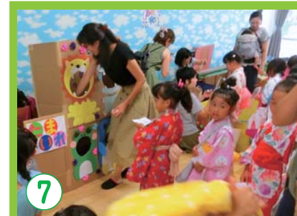
7 家庭連携と子育て支援を充実