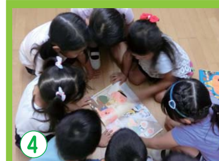
4 言葉に対する感覚を養う