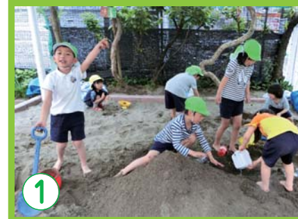
1 健康でたくましい心身を育てる

ひよこタイム 水曜日(毎月1回程度) 10:30～11:30 0～3歳児と保護者を対象に、親子のふれあいや子育ての情報交換の場を提供しています。