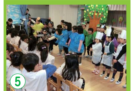
5 豊かな感性や表現する力を養う