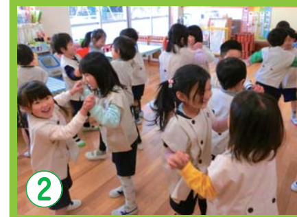
2 自立心を培い、人とかかわる力を養う