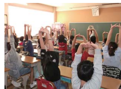
「ピースフルタイム」