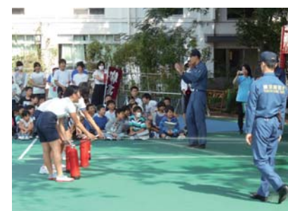
「安全教育推進校・避難訓練」