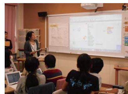
「学習・情報センターの活用」