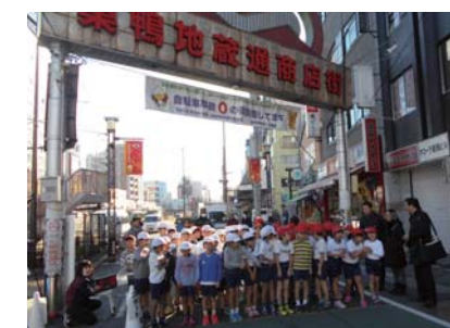
「巣鴨地蔵通り商店街持久走」