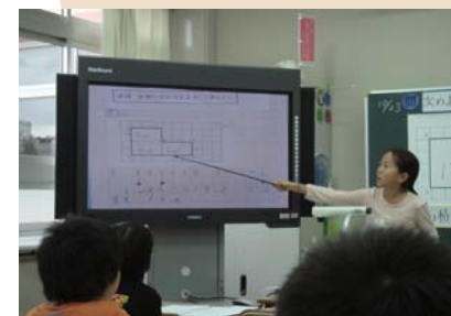
「わかる・楽しい授業」 ～ICT機器の活用～