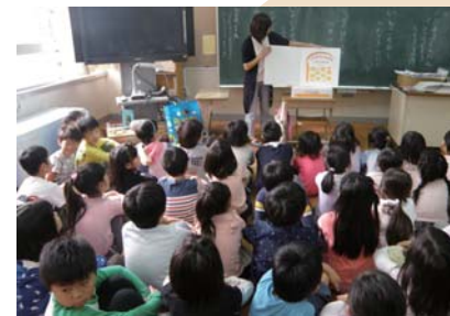
「本と仲よしの会」 ～保護者ボランティアによる読み聞かせ～