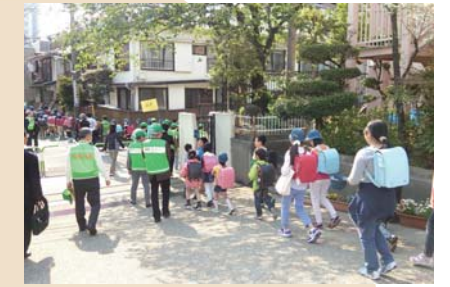
「巣鴨っ子安全安心パトロール」 ～地域と連携した児童の見守り～