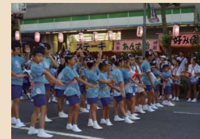
「PTA巣鴨っ子連」 ～東京大塚阿波踊りへの参加～