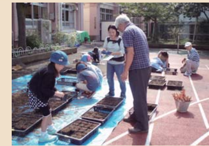
「フラワープロジェクト」 ～地域人材を活用した栽培活動～