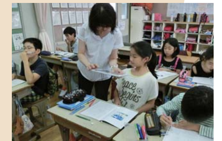
「算数習熟度別指導」 ～個に応じたきめ細やかな指導～