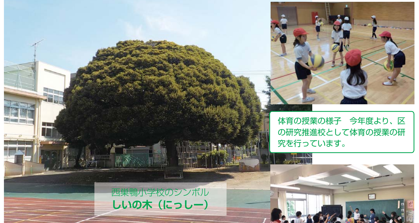
西巣鴨小学校のシンボル しいの木(にっしー)

「しいの木も笑ってる」(西巣鴨音頭) 作詞 西巣鴨小学校PTA 作曲 井田 洋子 おはおはおはおはよ 元気な声が かけてゆく 朝ごはんは 食べたかな 忘れ物は ないかな あれ Tシャツ裏返し しいの木も笑ってる あそあそあそあそほ 休み時間だ 校庭だ 西巣鴨ランドは 楽しいな ちびっこフジは いい眺め みんな仲良く遊べるよ しいの木も笑ってる たべたべたべたべたべよ おいしい給食 楽しみだ 今日の当番 任せてね 人気メニューは カレーかな 心込めて作られた しいの木も腹べこだ うれうれうれうれし うれうれうれうれし 友達たくさん うれしいな わたしはわたし うれしいな ぼくがぼくで うれしいな 先生にほめられた しいの木もうれしいな たのたのたのたのし 西巣鴨小学校 たのしいな 苦手勉強 あるけれど 大事なこと わかっている ステキな大人(ひと)になるために しいの木も見ているよ