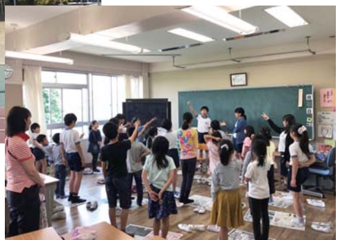
あじさい班(縦割り班)で、上級生と下級生が楽しく交流、ハッピータイム。