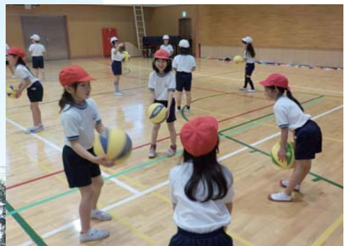
体育の授業の様子 今年度より、区の研究推進校として体育の授業の研究を行っています。