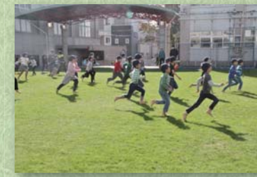
芝生 はだしで遊ぼう