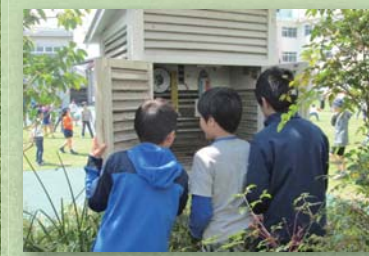
環境学習 緑のメッセンジャー