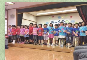
区民ひろば長崎 ひろば祭り