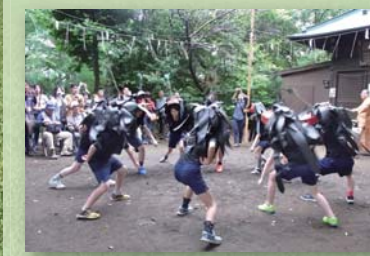
地域行事 長崎獅子舞