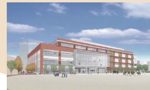
令和元年8月新校舎完成予想図