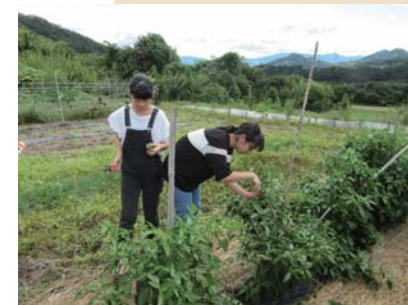
みなかみ移動教室での農業体験(2年)