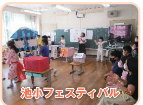
池小フェスティバル