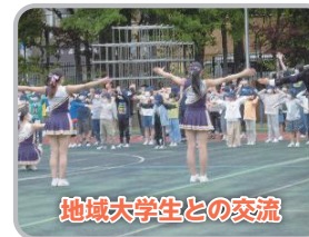
地域大学生との交流

本校は「大明小学校」「池袋第五小学校」が統合して「池袋小学校」となりました。 太陽を背に飛び立とうとしている鳥(池袋小学校の子供たち)をイメージしています。背後の日輪は三本で学校・家庭・地域を表しています。星形の「大」の字と日輪・星の「明」の字から「大明」の字を、星形の「五」辺と池袋の文字から「池五」の字を含み両校が融合されています。