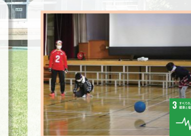
ゴールボール体験