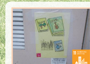
ユニバーサルデザインを調べよう