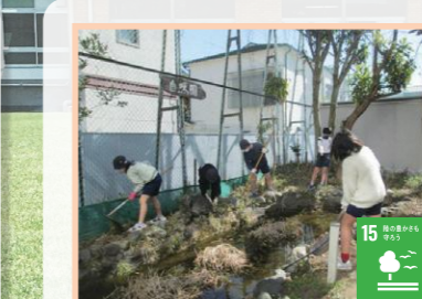
緑のメッセンジャー活動