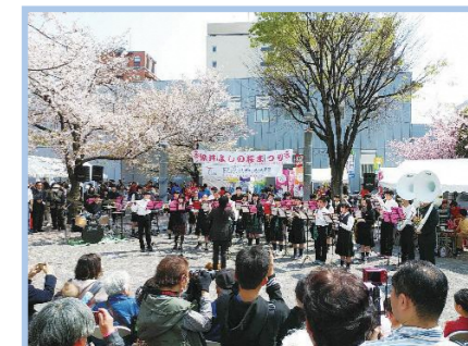
地域行事への参加