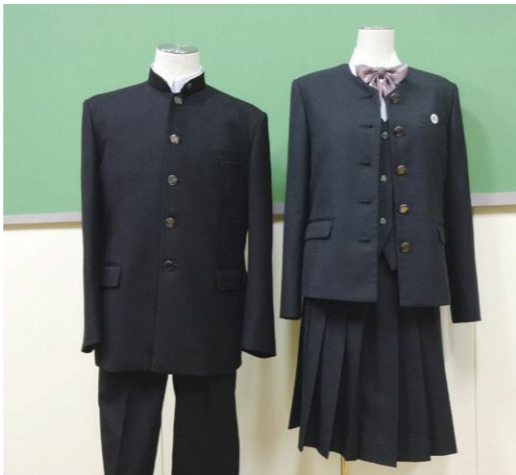
I型 II型 (III型は、II型がスラックスになったもの)