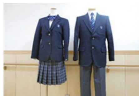
II型 I型 (II型はスラックスあり)