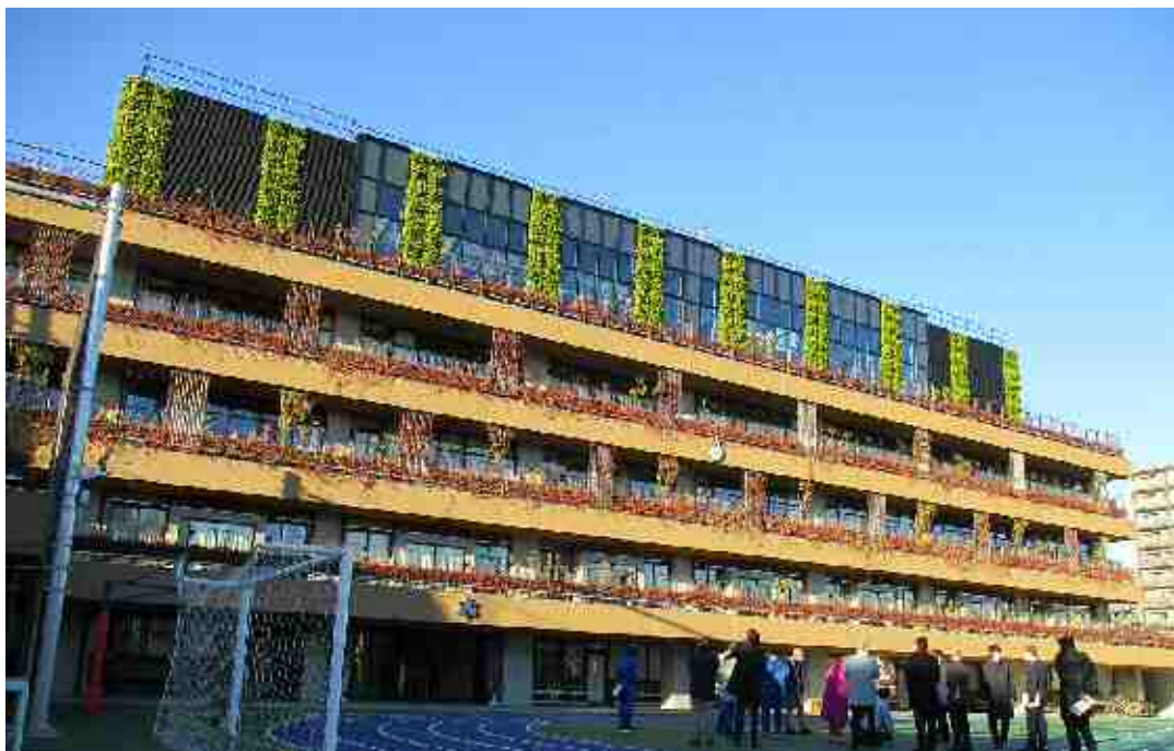
【池袋第一小学校（外観）校庭側】