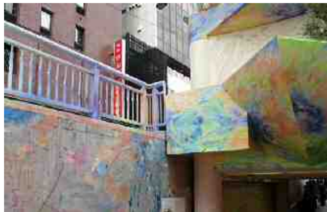
上【改修前】 右【改修後ウイロード北口側】