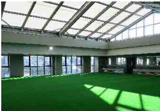
【池袋第一小学校（屋上階）プールに敷いた人工芝】