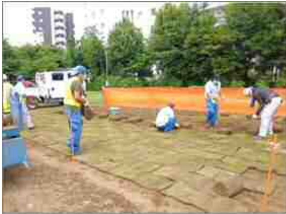
【区立南長崎はらっぱ公園への移植作業の様子】