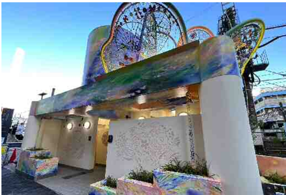
【池袋駅北口前公衆便所（ウイトピア）】