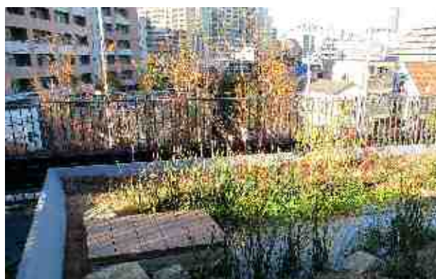
【池袋第一小学校（3階）テラスの柵】

しかしながら盛土やビオトープの枠が柵の近くまであるため、盛土の上に立つとテラスの柵の一部が本来必要とされる柵の高さより相対的に低くなっている。転落事故を防止するため、すみやかに適切な安全対策を講じられたい。