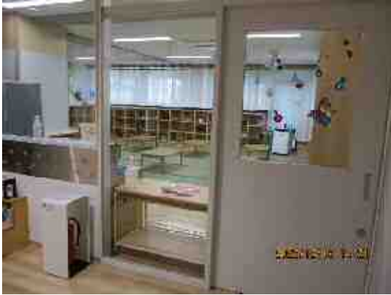
【子どもスキップの出入り口付近】

また、子どもスキップのコアスペースと廊下の間仕切りに素通しの1枚ガラスが設置されている。ガラスを使用することで、室内の様子を容易に確認できる利点がある一方、ガラスに児童が衝突した場合には大きな事故や怪我につながりかねない。衝突回避や飛散防止などの安全対策を検討されたい。