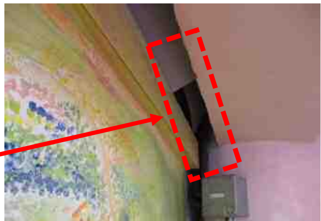
【ウイロード北口側壁面の隙間】