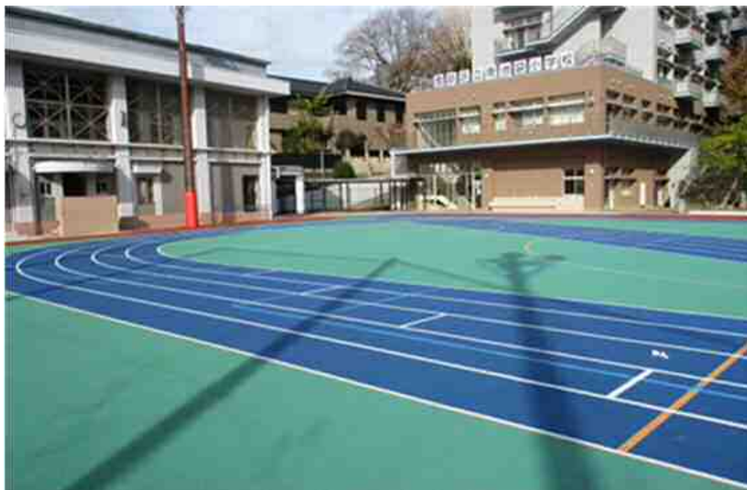
【 南池袋小学校 校庭 】