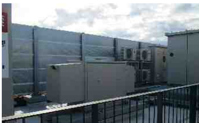
【施設（屋上）の防音壁】