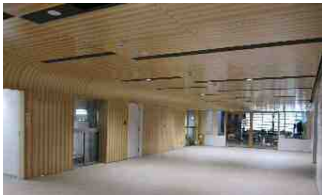
【池袋第一小学校（1階）木製壁・天井】