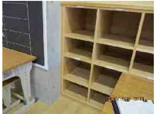
【普通教室のロッカー】