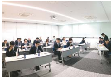
視察風景（さいたま市子ども家庭総合センター）