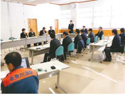
視察風景（糸魚川市消防本部）