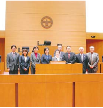
視察風景（町田市役所）