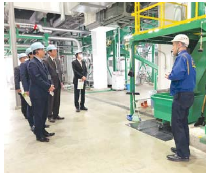
視察風景（株式会社アルファ城南島第2飼料化センター）