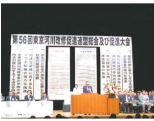
河川改修促進大会

都内の14区21市2町1村が加盟する東京河川改修促進連盟の第56回総会及び促進大会が5月24日、調布市グリーンホールで開催され、議長及び議員16名並びに区の関係者が参加しました。大会では東京全域の治水対策の促進を要望する宣言と、「治水事業の強力な推進」等を要望する決議を行いました。