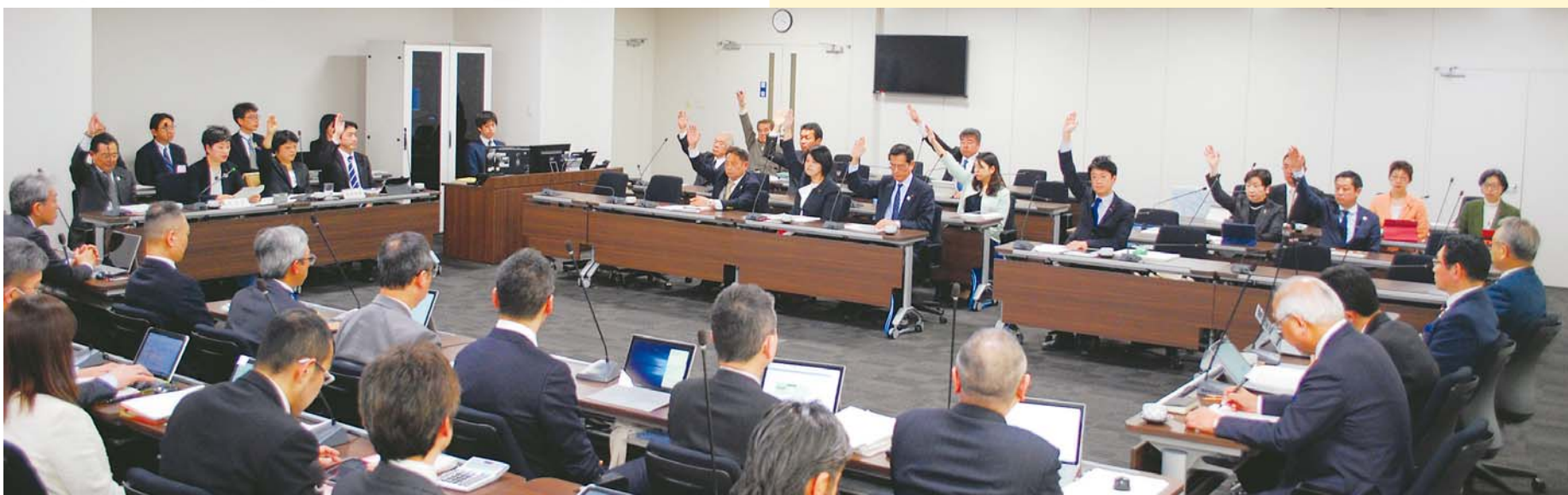
予算特別委員会の様子