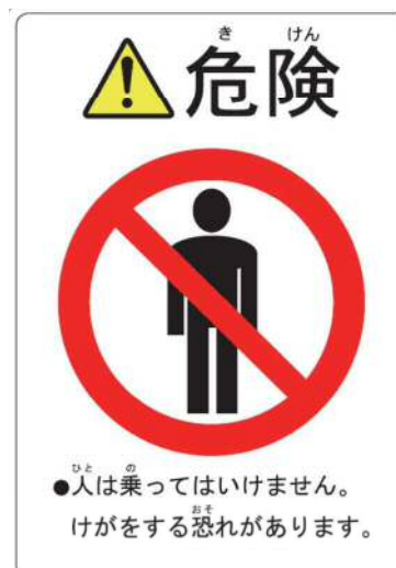
「搭乗禁止」ステッカーの例