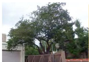
・造幣局正門のサクラ