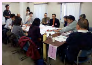
写真： 意見交換の様子(左) 書き込まれたマップ(下)