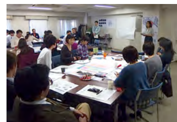
参加者の皆さんが熱心に説明を聞かれています。

第1回目にも関わらず、活発な話し合いが行われ、今後が期待される会となりました。また、初回のためいろんな意見が出て、もう少し論点を絞った方が良いとのご意見も頂戴しましたので、事務局でも今後の進め方の参考にさせていただきます。