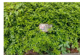
・造幣局内部はツツジが多い