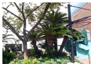
・造幣局出入口のソテツ