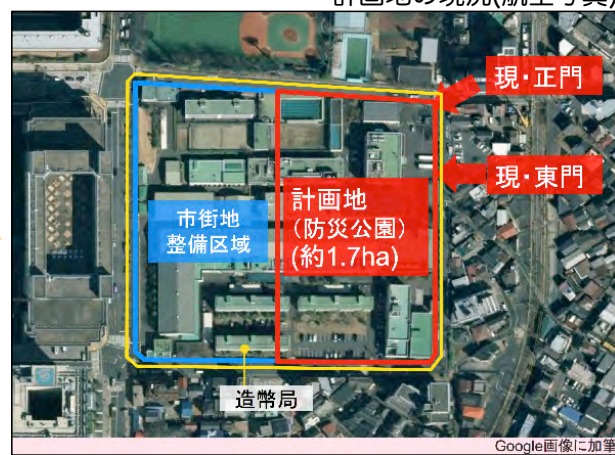
計画地の現況(航空写真)