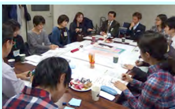
写真： 意見交換の様子(左) 書き込まれたマップ(下)