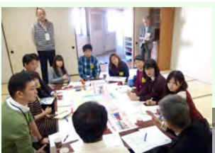
写真： 意見交換の様子(左) 書き込まれたマップ(下)