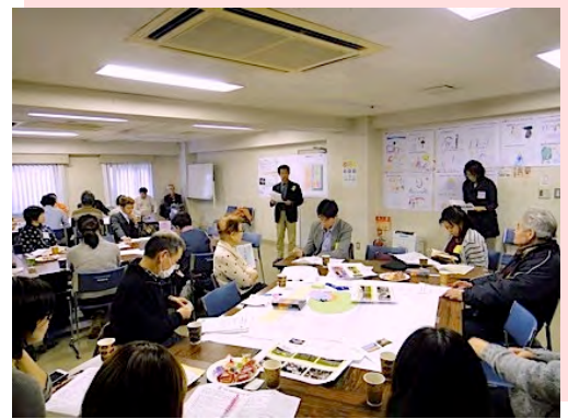
アドバイザーからプランするポイントの説明を受けています。

3回目にもなると、グループで協力し合いながら、いろいろなアイディアが出された公園プランがつけられました。