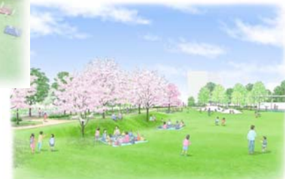
●イメージスケッチ：はらっぱから築山と遊具のある遊び場側をみる