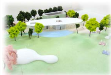
●模型：はらっぱから公園南西側をみた写真(池と管理事務所)