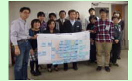
つつじグループのみなさん