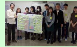
そてつグループのみなさん