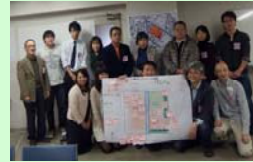
さくらグループのみなさん