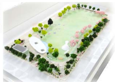
●模型：公園南東側からみた写真