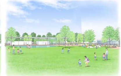
●イメージスケッチ：はらっぱから池と管理事務所側をみる